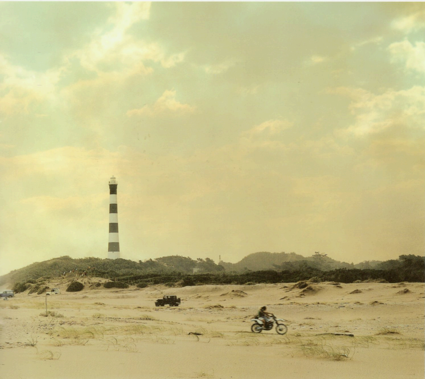
Juan Travnik. Claromecó 2004 #2 , fotografía, copia color sobre material RC, 120 x 60 cm. Primer Premio Adquisición