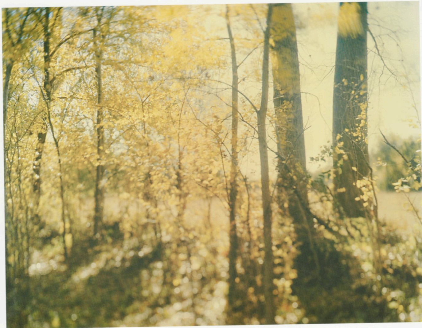
Bobby Lightowler. Sin título. Fotografía, 100 x 140 cm. Mención Especial del Jurado no-adquisición