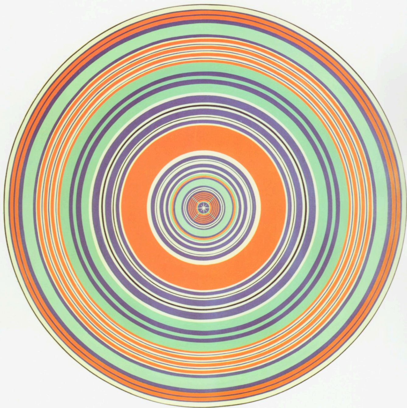
Eric Martinet. Sin título , 2003, acrílico sobre tela, 180 cm de diámetro. Mención no-adquisición