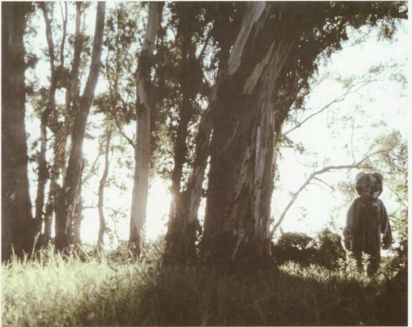
Patricio Gil Flood. Proyecto ESPECIE , 2004, fotografía con intervención digital, 80 x 100 cm. Mención Especial del Jurado no-adquisición