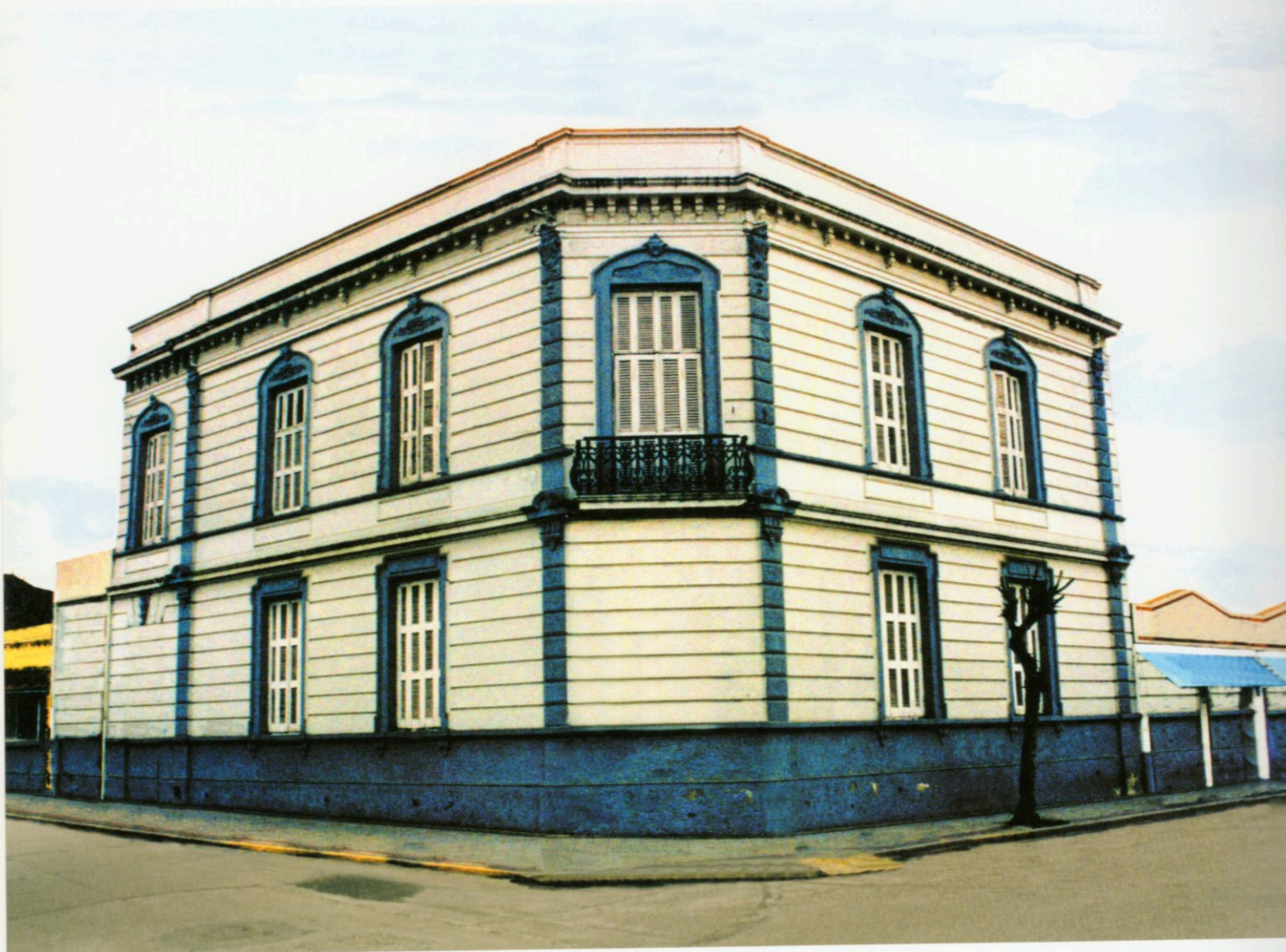
Rosalía Maguid. Serie "Einstellung", fotografía con intervención digital, 150 x 100 cm. Segundo Premio Adquisición