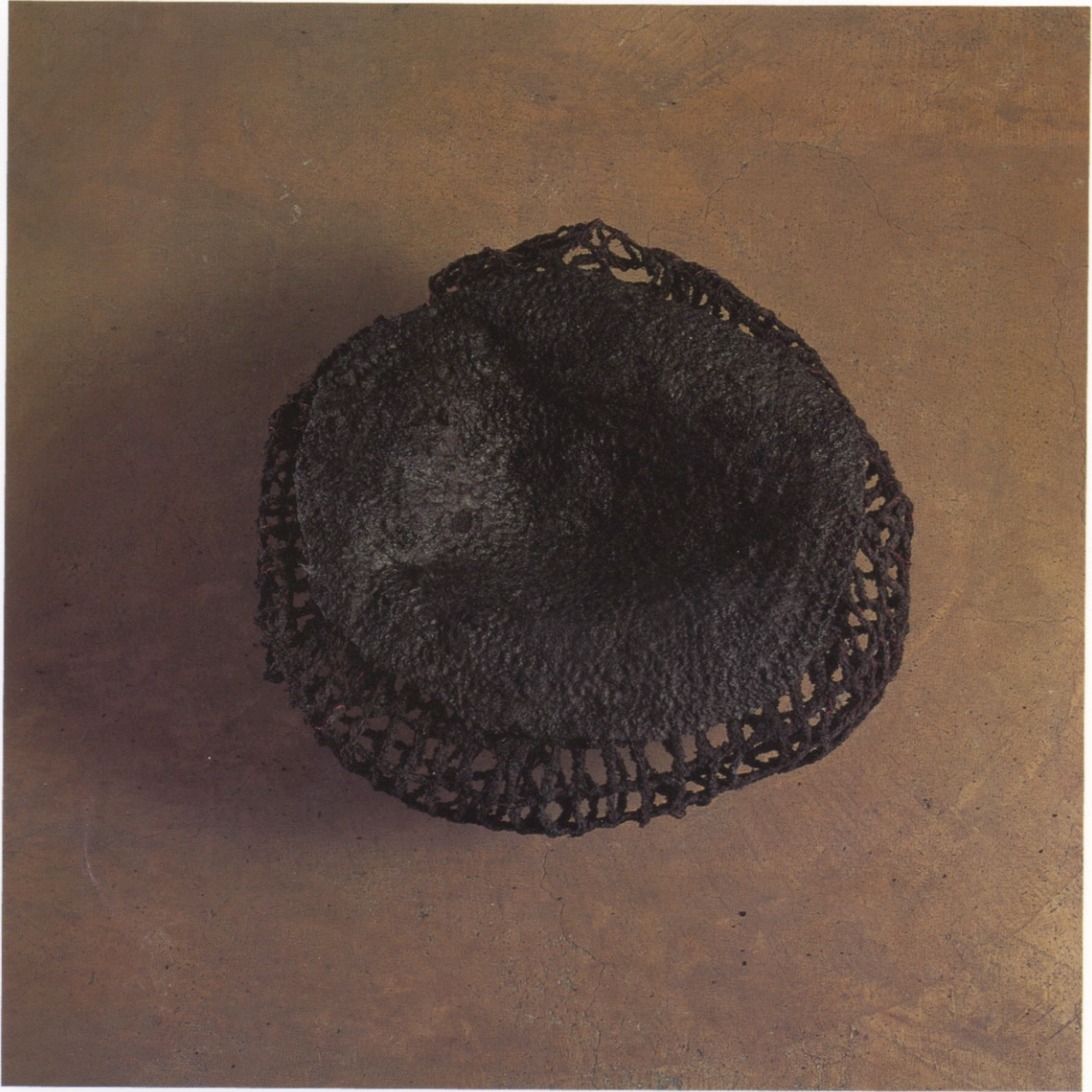
Gotera. 35 cm. de diámetro. Crochet, metal, azúcar y carbón. 1998.