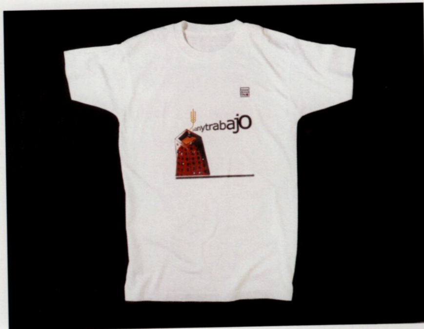
Omar Panosetti. Cayetano , instalación, 2002