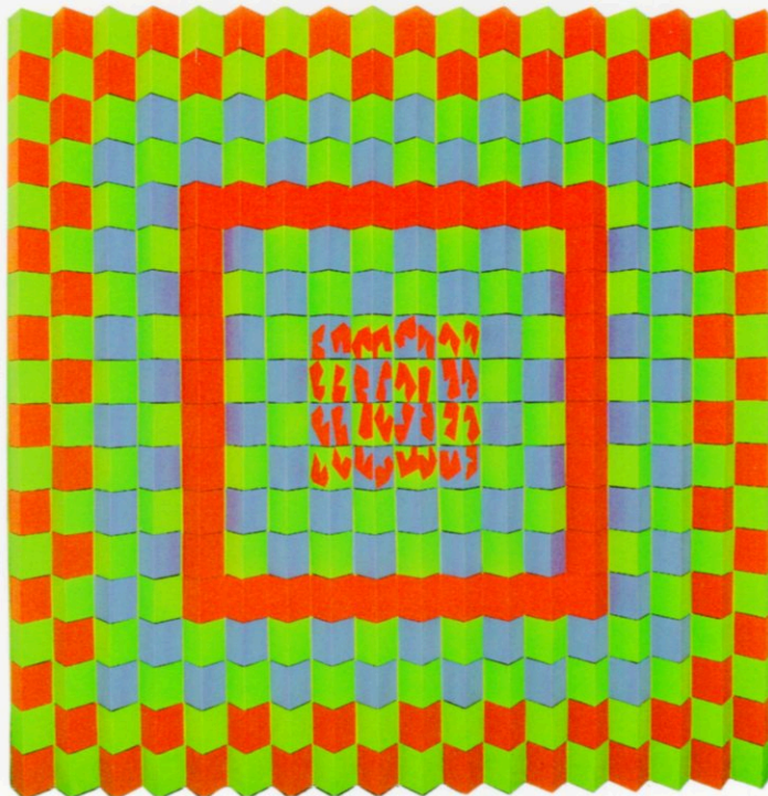
2 da Mención especial Marcela Gasperi