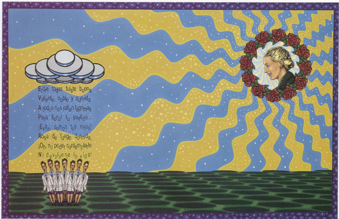
"Evita, somos tus niños" ( Fantasia Justicialista ), acrílico sobre tela, 90 x 140 cm., 2000