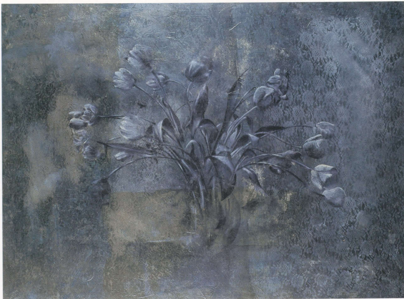
"Para que no digan que no hablé de las flores" (1995)