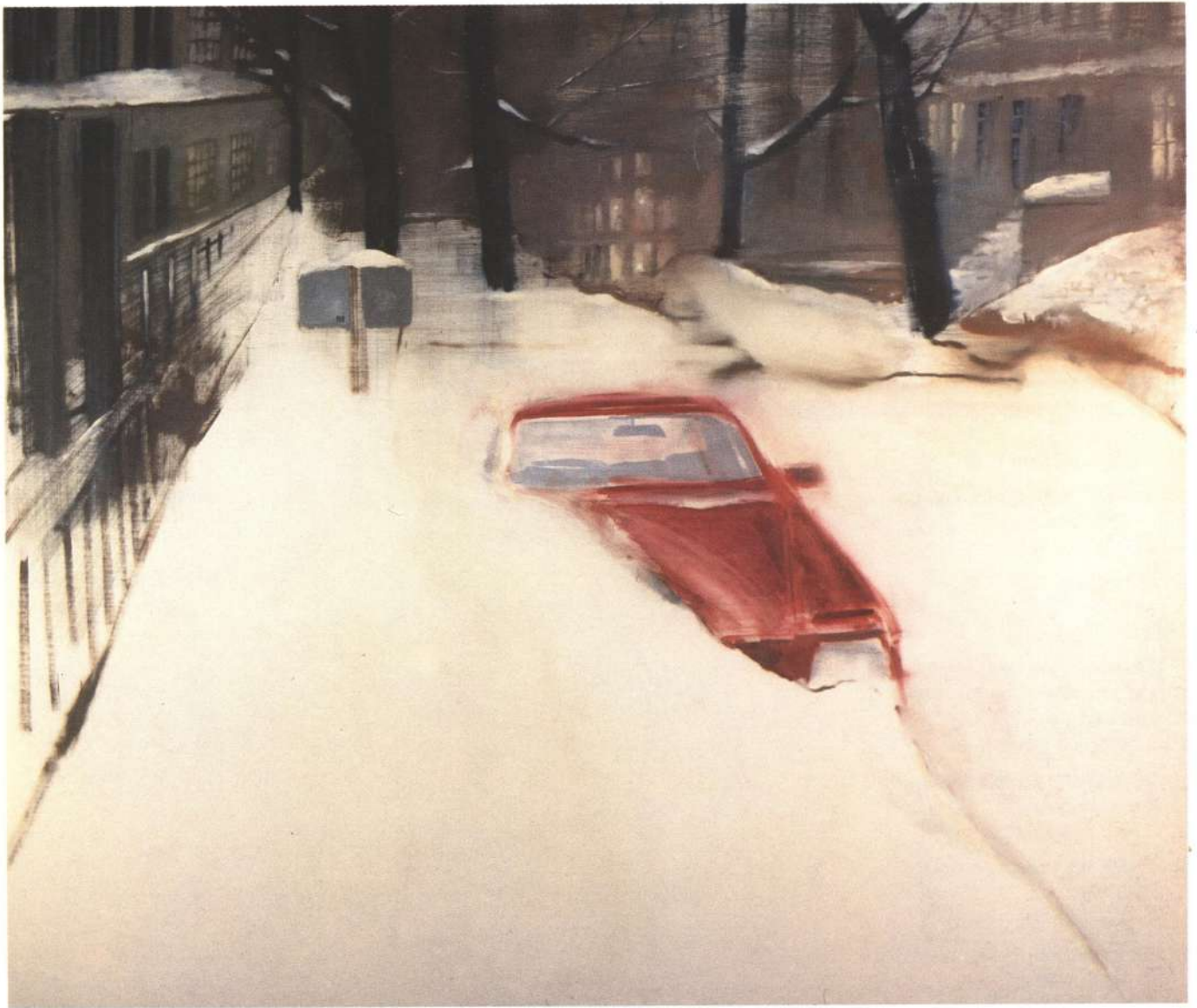
72 y calle Amsterdam. 1991. óleo s/tela. 170 x 200 cm.