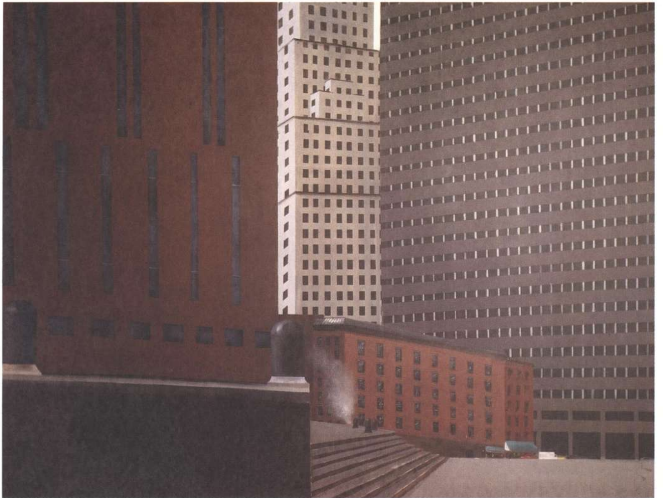
Wall Street. 1992, acrílico s/tela 200 x 260 cm.