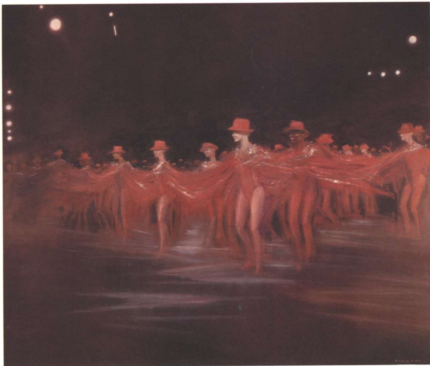
Radio City Music Hall. 1992. óleo s/tela, 170 x 200 cm.