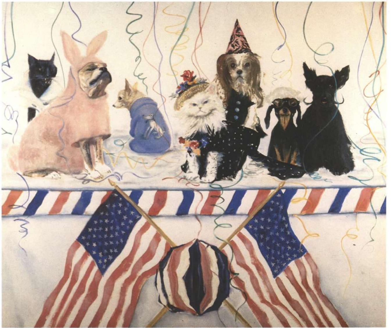
Fiesta de animales, invitados especiales: Andy Warhund y Salvador Doggy. 1991, óleo s/tela. 170 x 200 cm.