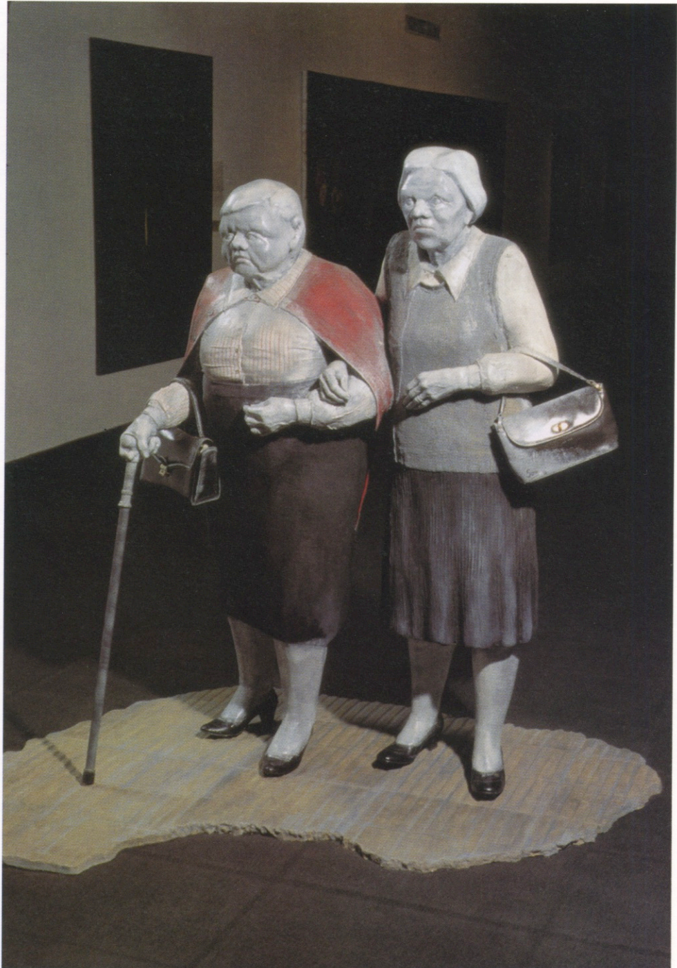
En yunta · Técnica mixta · 1994