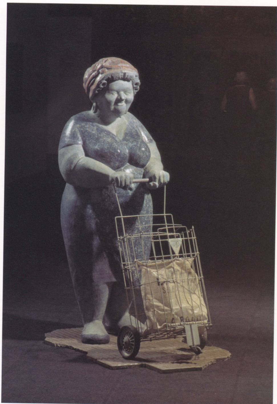
La gorda del cbanguito. · Técnica mixta · 1990