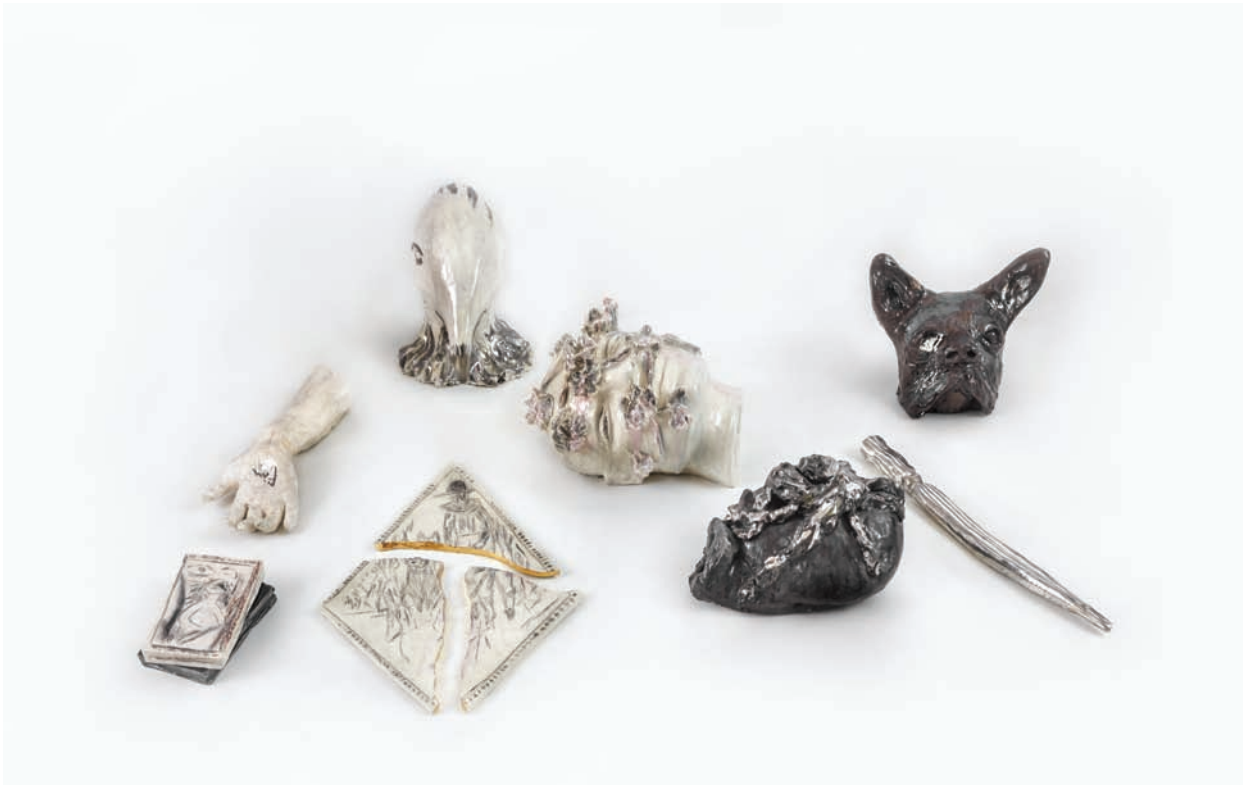
Grupo de obras Cerámica esmaltada Medidas variables 2015