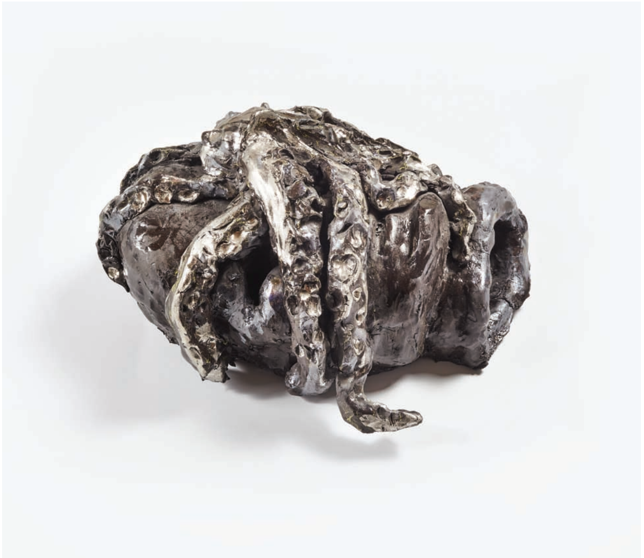
Virgen loca Cerámica esmaltada, y lustre de platino 33 x 37 x 30 cm. 2015