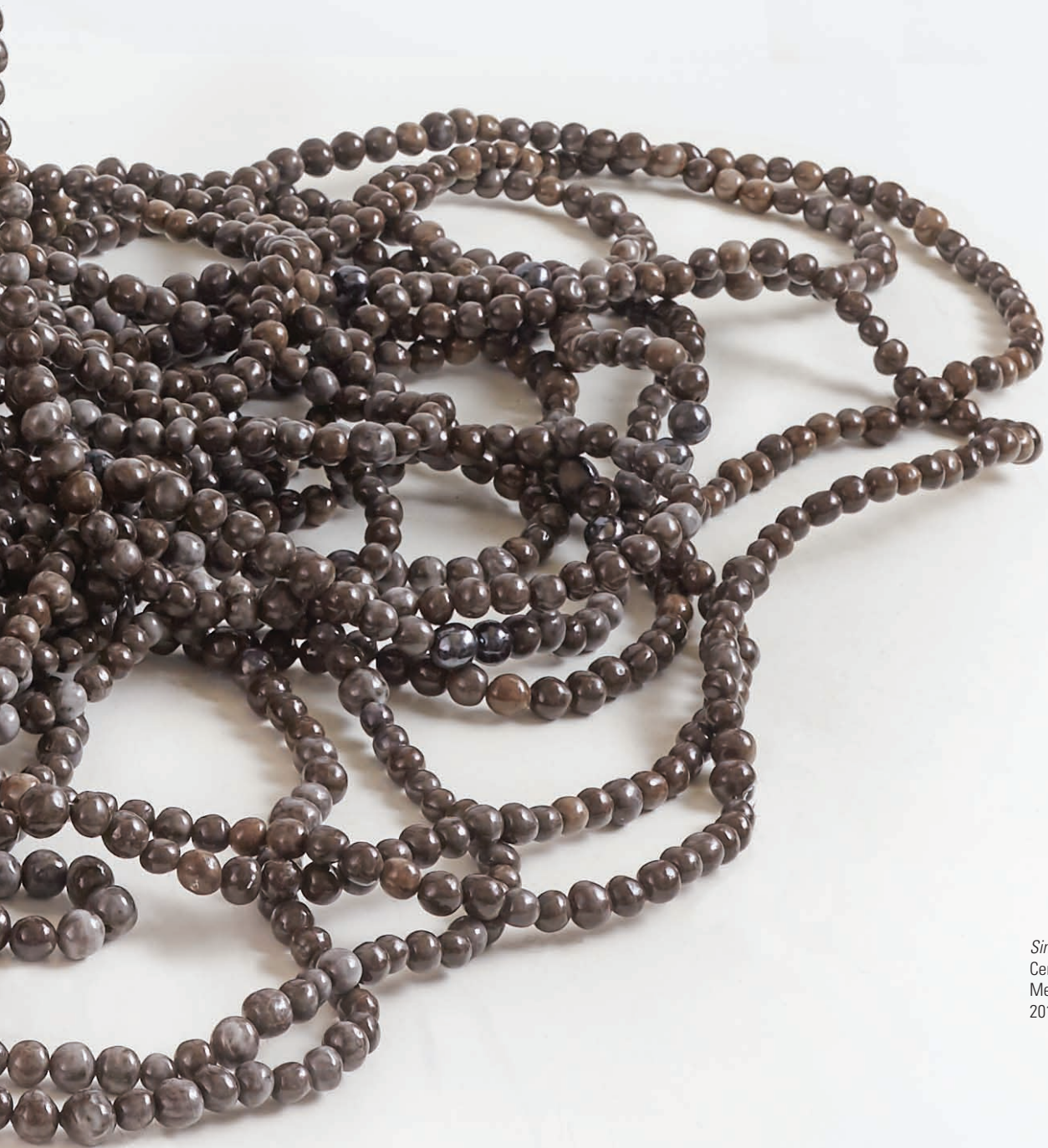
Sin título Cerámica esmaltada Medidas variables 2015