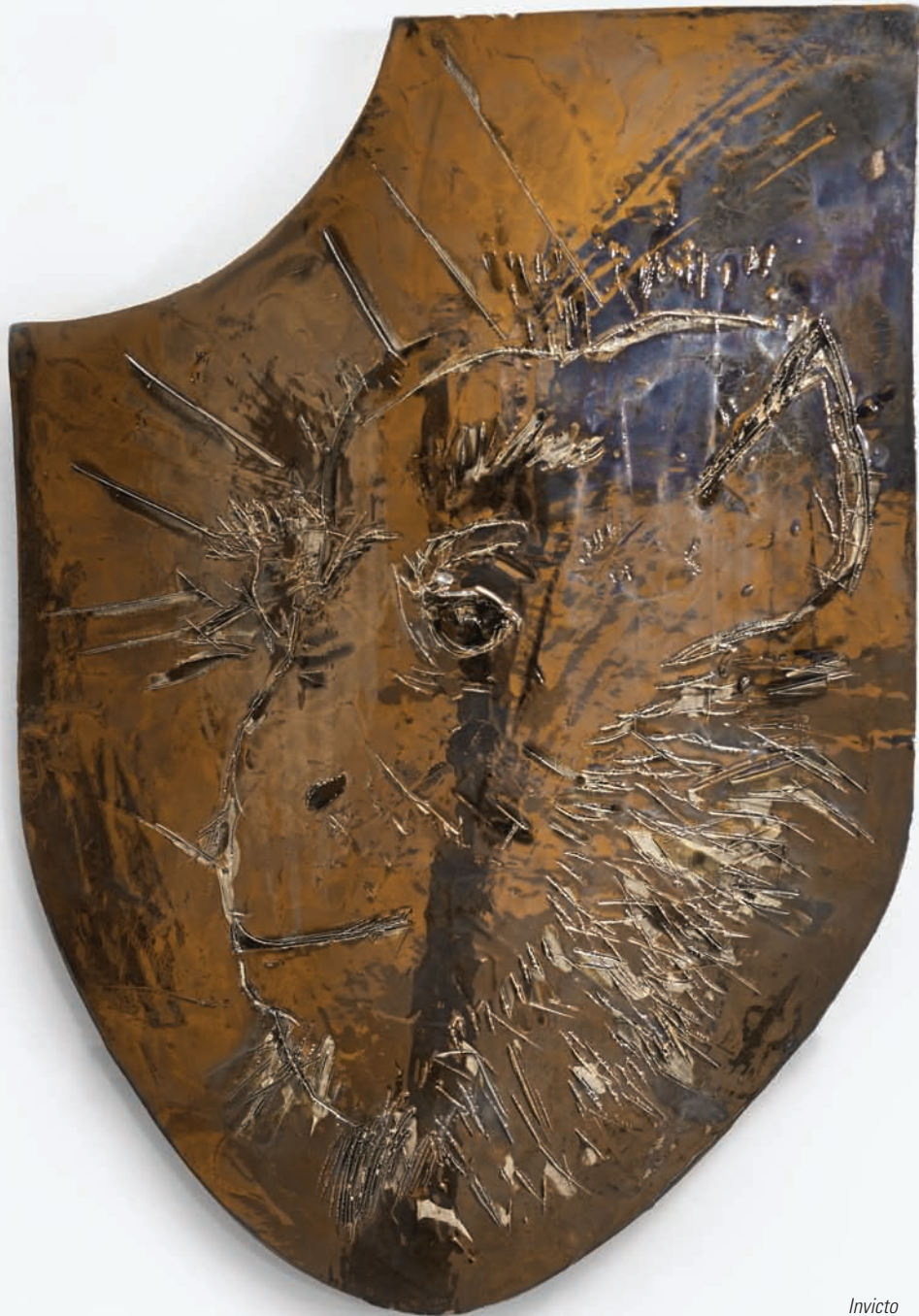
Invicto Cerámica esmaltada Instalación medidas variables 46 x 33 x 3 cm. 2015