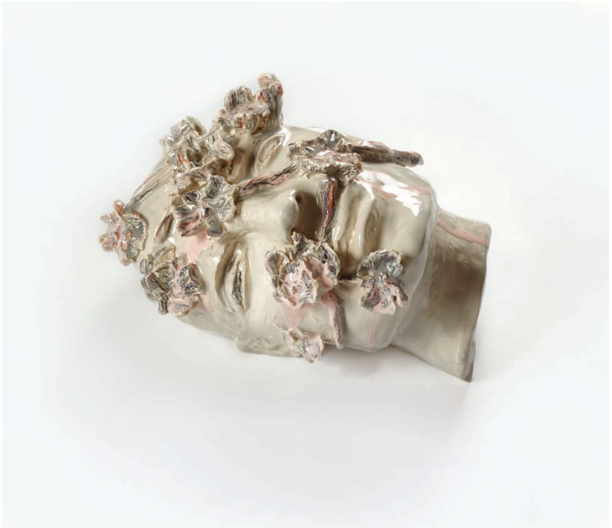
Virgen loca Cerámica esmaltada 30 x 39 x 28 cm. 2015