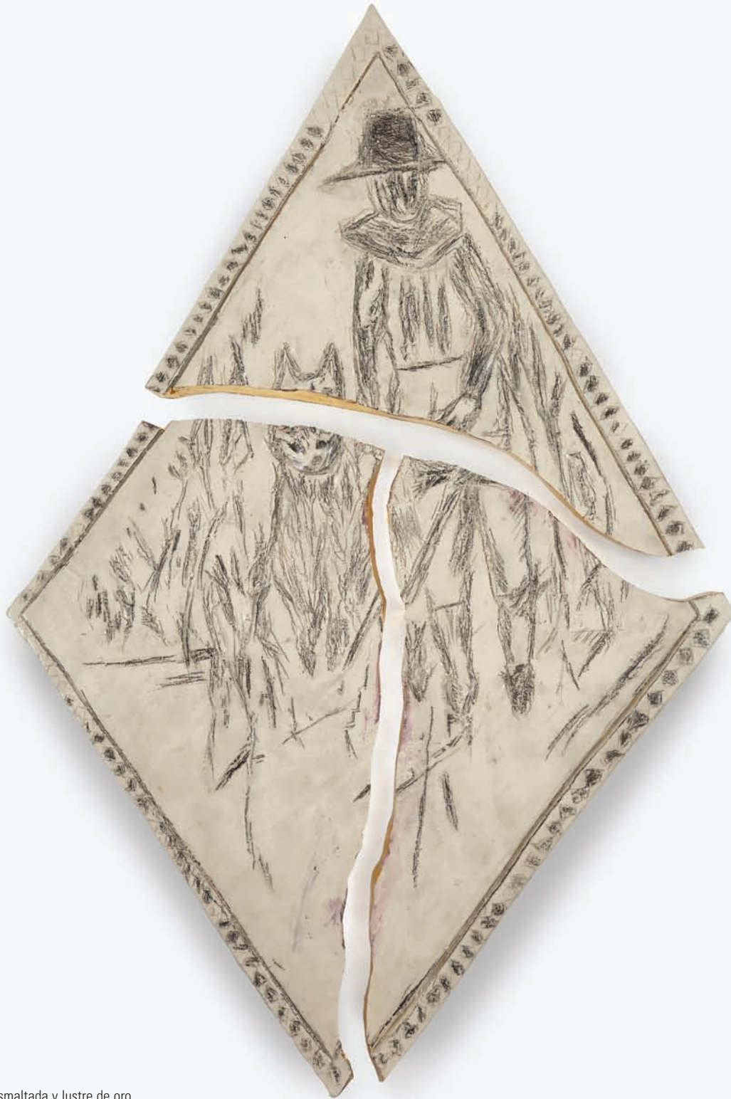
Invicto Cerámica esmaltada y lustre de oro 57 x 36 x 1,2 cm. 2015