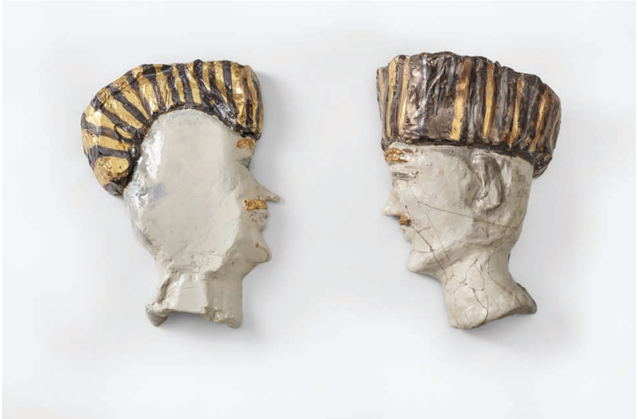
Sin título Cerámica esmaltada 9 x 34 x 24 cm. / 16 x 35 x 27 cm. 2015