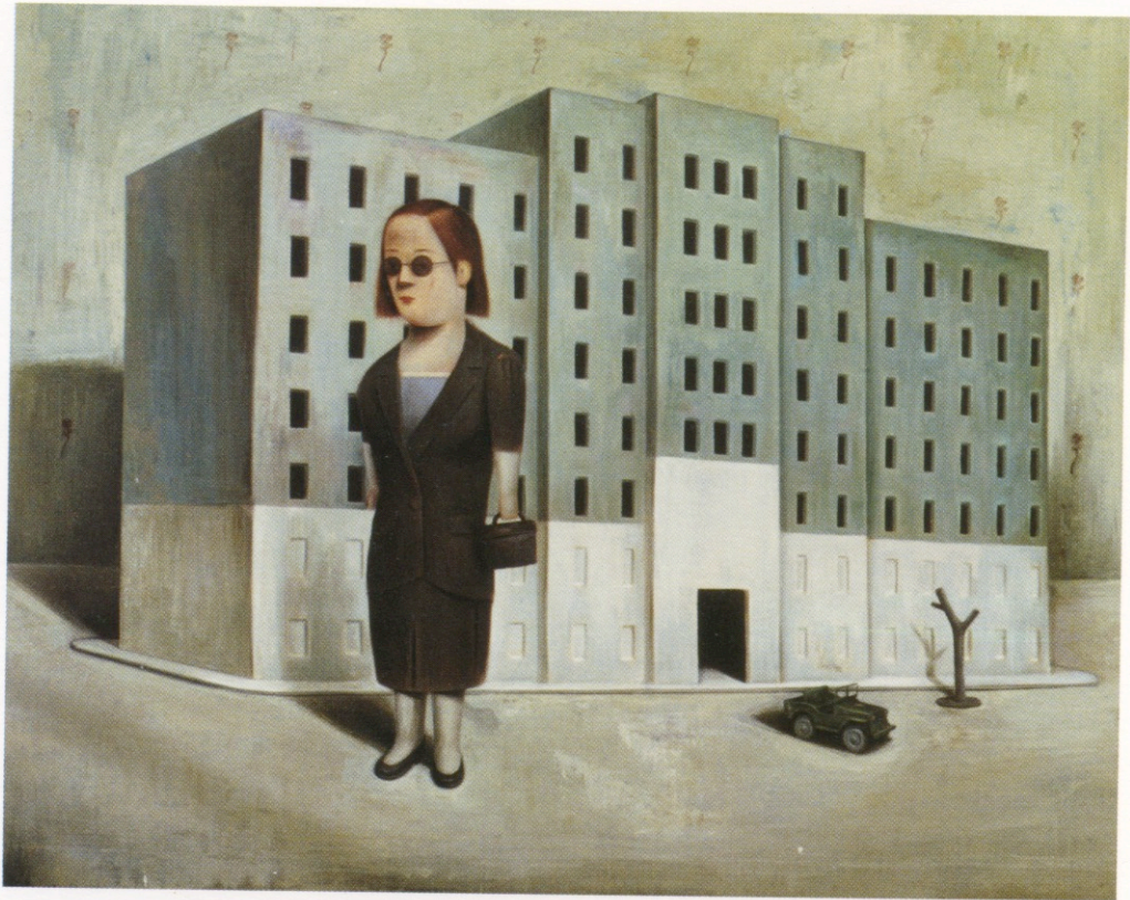
Aquí debería haber rosas : acrílico sobre tela, 230 x 180 cm., 2001.