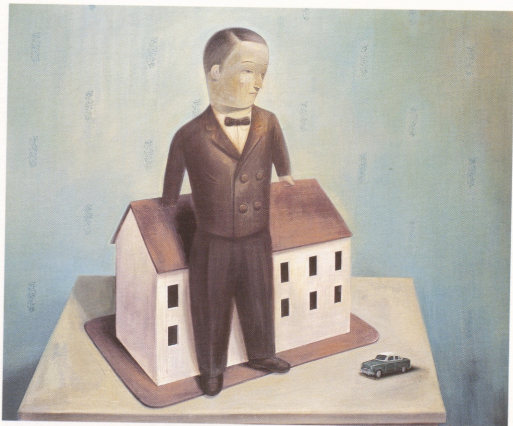
Siamo tutti bene ; acrílico sobre tela, 170 x 141 cm., 2001.