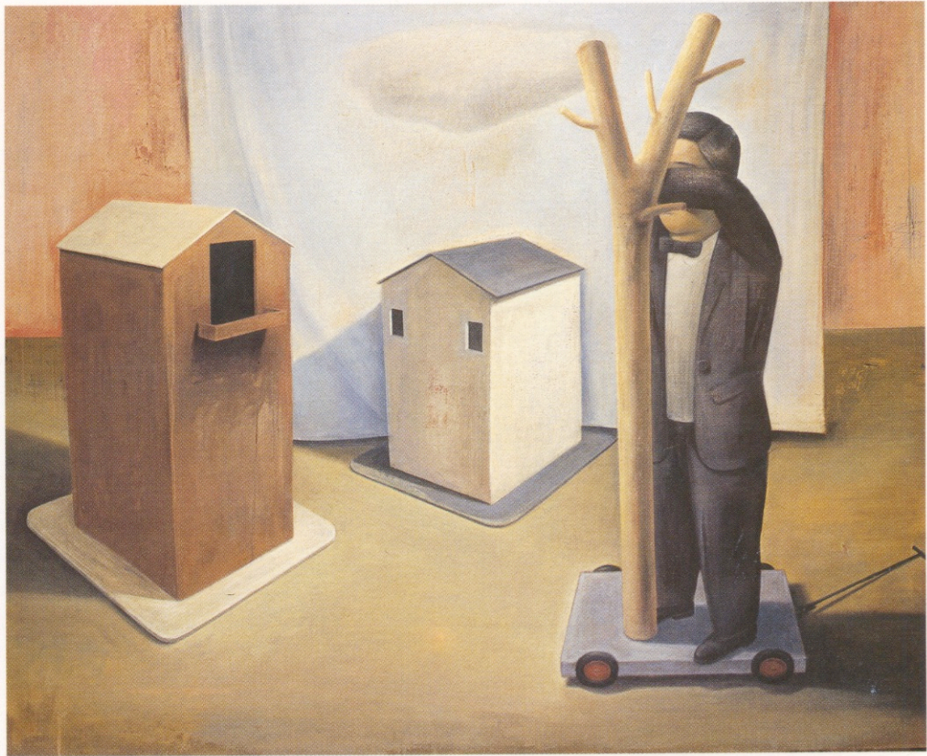
Simulacro ; acrílico sobre tela, 200 x 160, 2001.