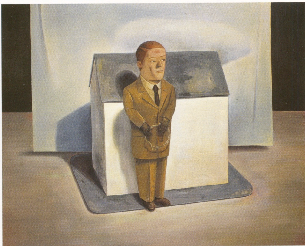
Ensayo para un olvido ; acrílico sobre tela, 200 x 160 cm., 2001.