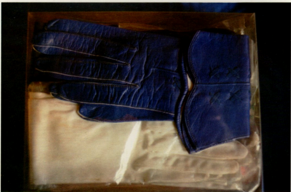
Luciana Betesh; sin título de la serie Gotas , fotografía - copia tipo C, 40cm x 50 cm, 2000 / 2001.