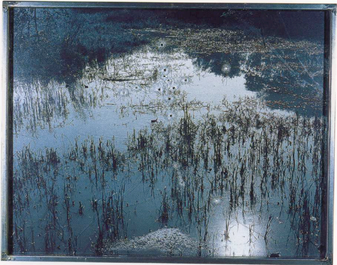
La isla del sentido. 1996

gando a la lectura de la imagen sólo desnuda y degradada, son todos elementos que se abren sobre el pensamiento alegórico.