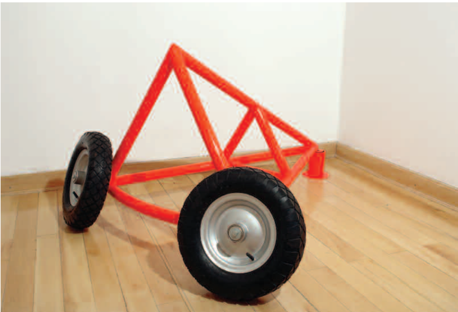
ERNESTO BALLESTEROS Sin título 2011 (carro que gira sobre su propio eje) Hierro y rueda 125 x 145 x 75 cm