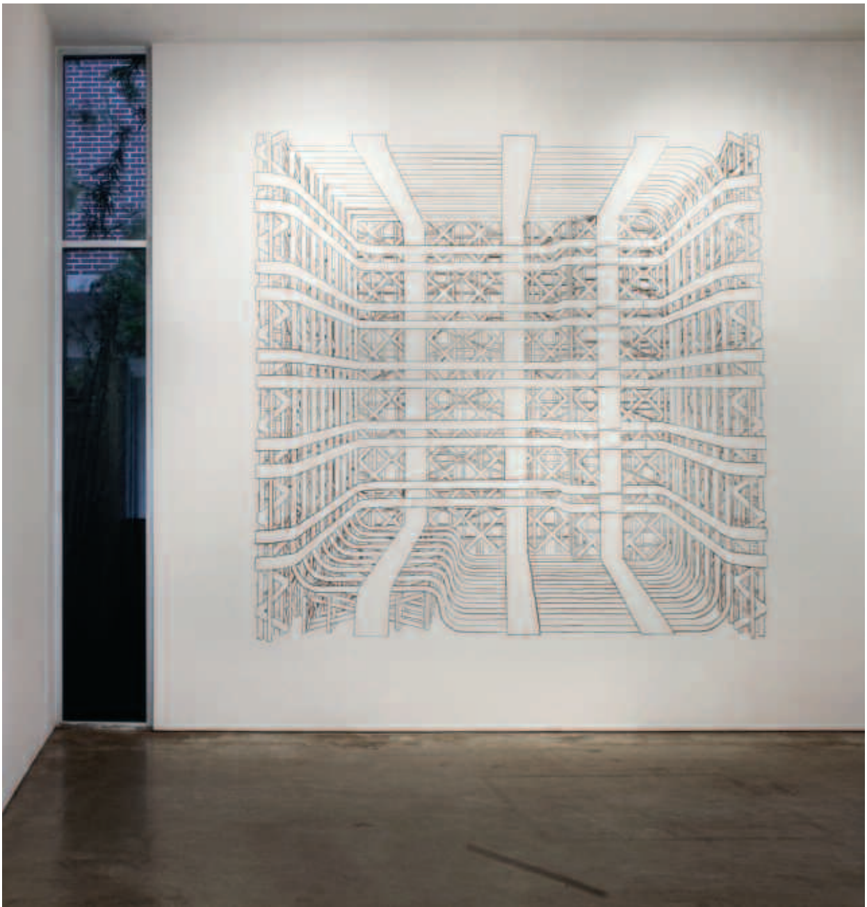
PABLO SIQUIER "0301" 2008 Carbón sobre pared 300 x 300 cm Sicardy Gallery, Houston