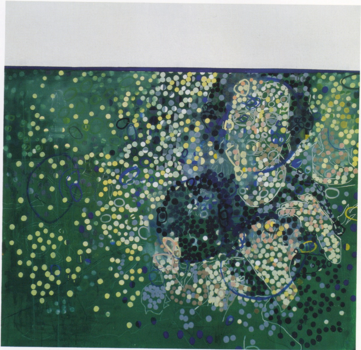
ADN. 180 x 180 cm. Oleo, acuarela y temple sobre tela. 1998.