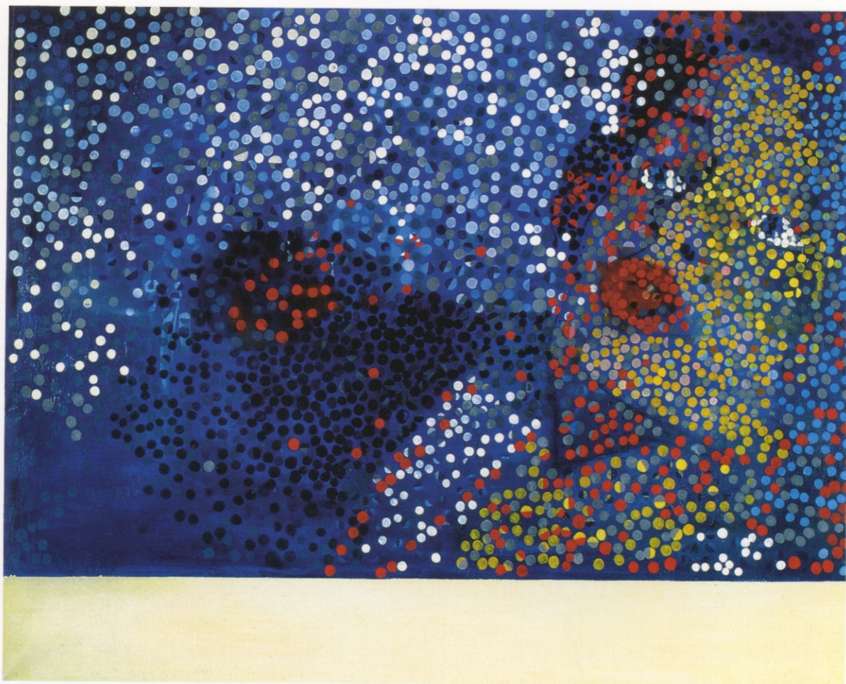
Retrato. 160 x 200 cm. Oleo y acuarela sobre tela. 1998.