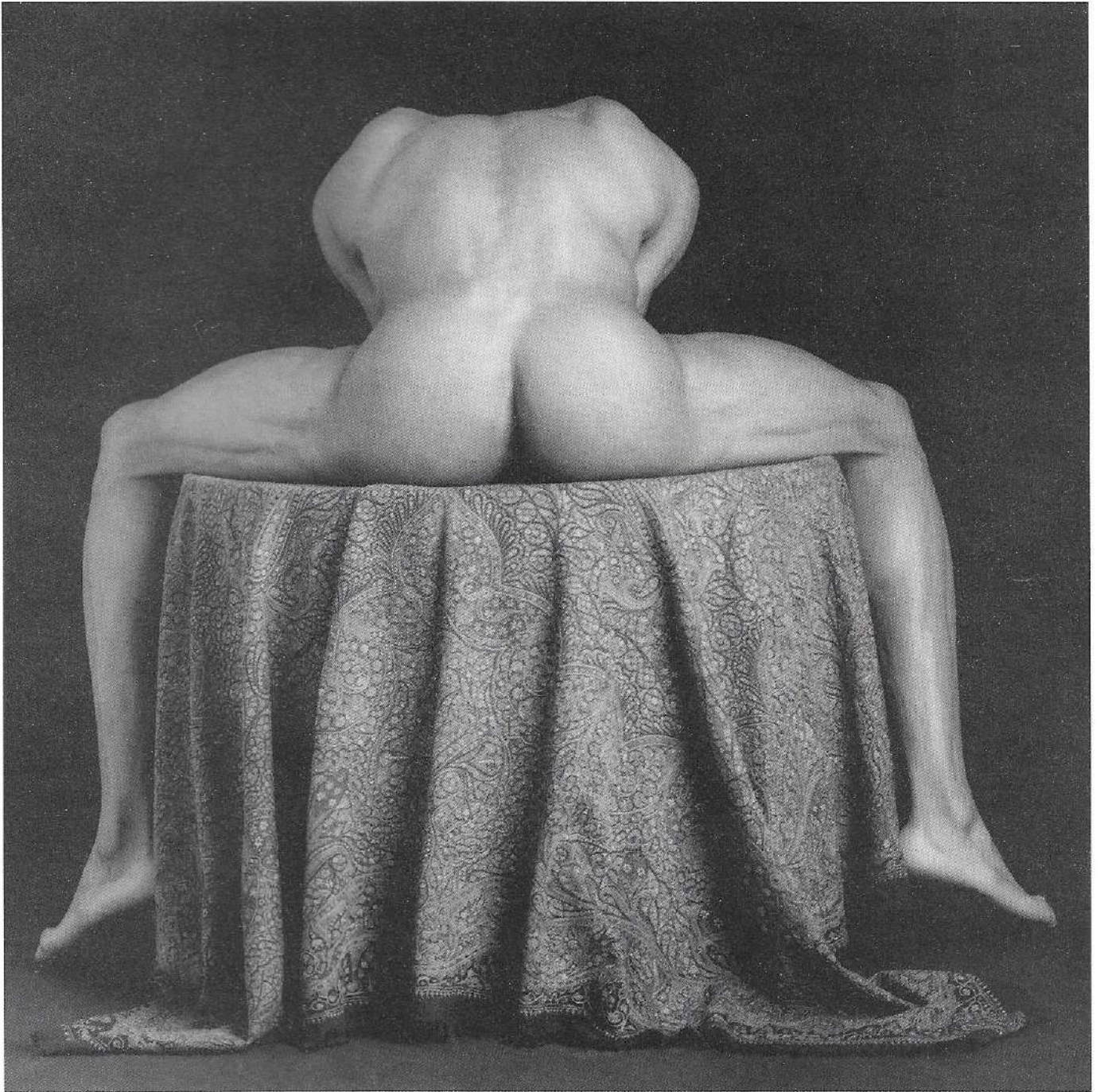
Carlton. 1988. gelatin silver print. 61 x 51 cm.