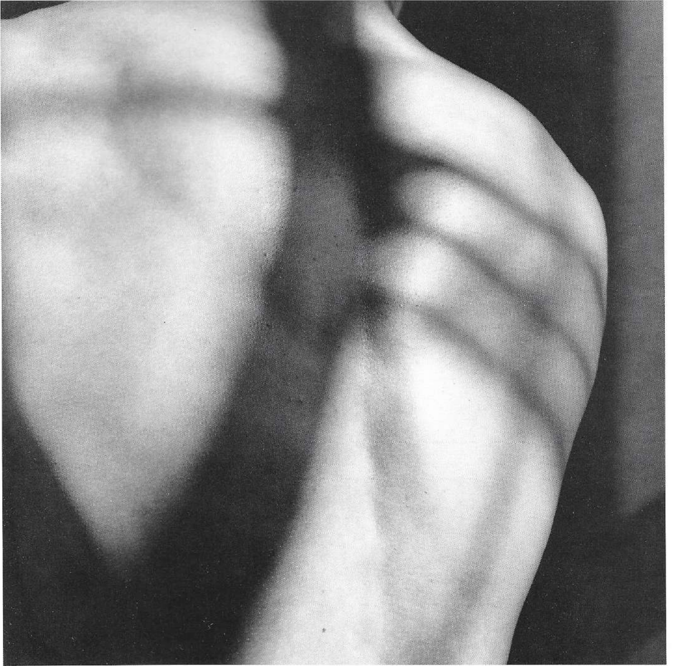
Vibert's back. 1984, gelatin silver print. 51 x 41 cm.